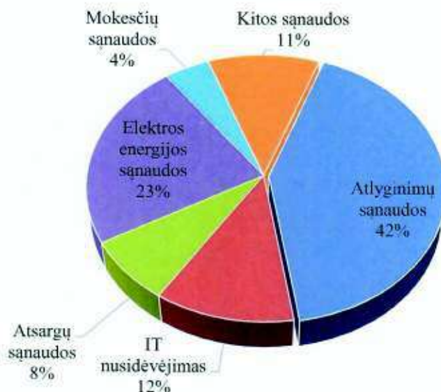
3 pav. Sąnaudų struktūra pagal straipsnius, proc.

UAB „Radviliškio vanduo“ sąnaudos 2022 m. sudarė 2472,0 tūkst. Eur, iš jų: pagrindinės veiklos sąnaudos sudarė 2078,5 tūkst. Eur, bendrosios ir administracinės – 390,8 tūkst. Eur. Parduotų prekių sąnaudos sudarė 0,6 tūkst. Eur, kitos veiklos – 1,8 tūkst. Eur, finansinės ir investicinės veiklos – 0,3 tūkst. Eur. Patirtos sąnaudos lyginant su praėjusiais 2021 metais padidėjo 459,2 tūkst. Eur arba 22,8 proc.